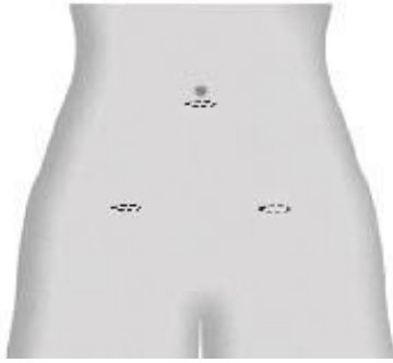
Figuur 2 Littekens na een baarmoederverwijdering door middel van een kijkbuisoperatie