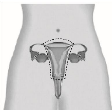
Figuur 3b Supravaginale baarmoederverwijdering: behoud van de baarmoederhals

Besprek dit voor de operatie met de gynaecoloog. Een enkele keer komen pas tijdens de operatie afwijkingen aan één of beide eierstokken aan het licht. Bij één afwijkende eierstok neemt de gynaecoloog alleen deze eierstok weg.