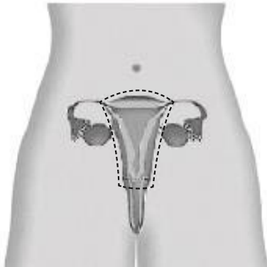
Figuur 3a De baarmoederverwijdering zelf

Voor het vrijen en het plassen lijkt er geen verschil te bestaan of de baarmoederhals nu wel of niet verwijderd wordt. Wetenschappelijk onderzoek toont geen verschil. Soms blijkt tijdens de operatie dat het verstandiger is de baarmoedermond alsnog te laten zitten. Dit kan bijvoorbeeld als er een vleesboom in de weg zit of als er verklevingen zijn in de onderkant van de buikholte.