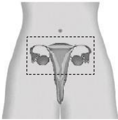
Figuur 3c Baarmoederverwijdering met verwijdering van de eierstok(ken) en eileider(s)

Bij afwijkingen aan beide eierstokken zal de gynaecoloog zoveel mogelijk van ten minste één eierstok behouden om zo een voortijdige overgang te voorkomen. De eierstokken kunnen zowel via de schede als via de buikwand worden verwijderd.